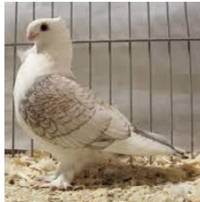
Oud oosterse meeuwen

Indien onbezorgd dan graag retour redactie S.A.O-er : G.v.d.Broek Goedroenstraat 15 3813 WG Amersfoort