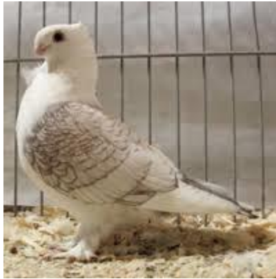
Oud oosterse meeuw